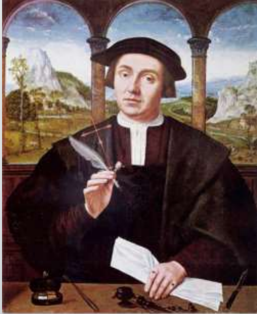
Картина XVI века, изображающая нотариуса, работы фламандского живописца Квентина Массиса

Нотариус ( лат. notarius — писарь, секретарь) — лицо, специально уполномоченное на совершение нотариальных действий, среди которых свидетельствование верности копий документов и выписок из них, свидетельствование подлинности подписи на документах, свидетельствование верности перевода документов с одного языка на другой, а также некоторые другие действия, нормы которых отличаются друг от друга в различных странах.